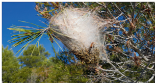
Nid de chenilles processionnaires

Ce service permet de signaler un problème sur le domaine public (également sur le domaine privé pour les chenilles processionnaires).